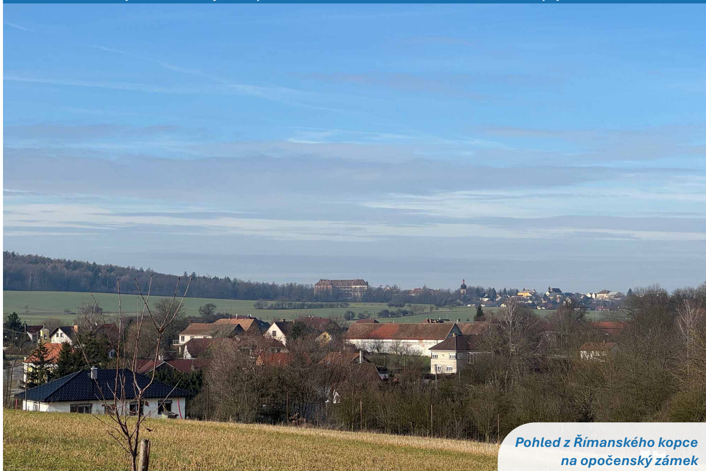
Pohled z Římského kopce na opočenský zámek

Sledujte naše aktivity na https://www.facebook.com/obecsemechnice/ a zapojte se také!