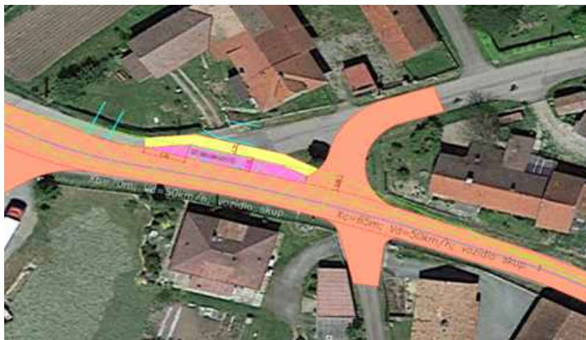
Směr z Trnova, varianta č. 1

Náš záměr vybudovat uvedené zastávky podporuje i příprava na realizaci výstavby chodníků ve směru od čp 21 po čp 1 (směr od křižovatky směrem k poslednímu domu v obci ve směru na Podchlumí), kterou má obec v plánu a rovněž tak instalace orientačního radaru (měřiče