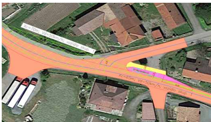
Směr z Trnova, varianta č. 2