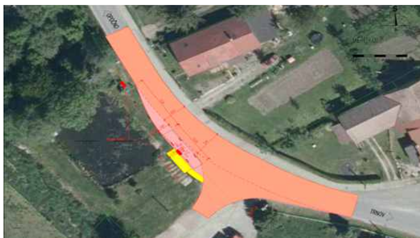
Směr do Trnova

rychlosti) který obec chce v jarních měsících tohoto roku instalovat před domem p.í. Doubkové, tedy na vjezdu do obce ve směru od Trnova.