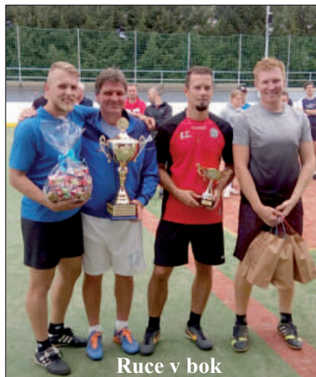
Ruce v bok

pušky, 4. Semechnice X, 5. Tři promile, 6. Sokol Opočno, 7. Bačetín, 8. Méněcennost