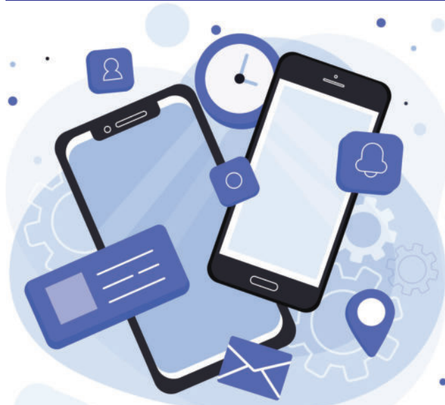
Aplikace ke stažení pro iOS