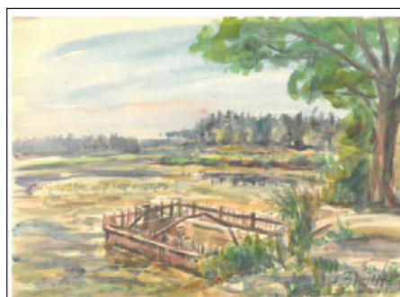
Semechnice _ Podchlumí - sroubek u Pohlá

„Rozšiřuje se evropská móda, svěrázky ubývá, je to velká škoda. V muzejích se trublách ty památky spící, zachycují tužkou svět mizějící...“